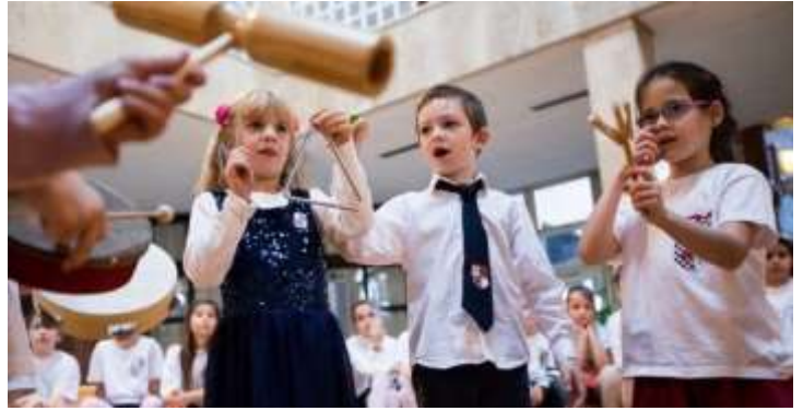
Kodály-módszer a 21. században.

Következtetés: Az életformában és annak fenntartásában rejlik a városrehabilitáció módszere és sikere. Abban az életmódban, amely „üzemszerűen” érlel helyi kultúrát, megjelenítve azt pl. a lakó- és munkahelyek alakításában, a közterek használatában, a közéletben, a gazdálkodásban, a viselkedésben. Fennköltén ideidézhetjük: „A falak ereje nem a kőben van, hanem a védők lelkében”. 7 Témánkra értelmezve: az „örökség ereje” nem a kőben van, hanem a „közösség lelkében”.