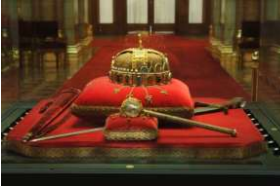
A Szent Korona és a koronázási ékszerek a Parlamentben

A palota rendbehozatala összetett ügy, ezért különös figyelmet, átgondoltságot igényel a múlt-jelen-jövő történelmi ívében. Sok elképzelés, terv létezik a palota funkcionális „berendezésével” kapcsolatban. Mégis, megkockáztatható, hogy széleskörű konszenzust élvez a megállapítás: a Budavári Palota elsősorban a magyar állam történelmi reprezentációja. Uralkodói – legmagasabb közjogi – székhely és rezidencia.