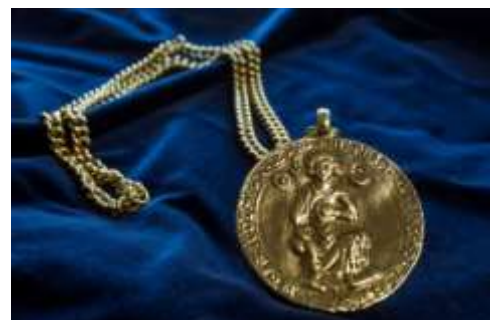
Aranybulla pecsét. Az alkotmánybírák az Aranybulla pecsét másolatát viselik talárjukon tisztességük jelképeként.

Történelmi-kulturális örökségünk rendkívül gazdag és aktuális üzenetekkel teli. Egy példa az állam(történet) és a fenntarthatóság összefüggésére. 1351-ben a Budai Várban hirdették ki a megújított Aranybullát az ősiség törvényével, amely a földbirtokok feletti rendelkezést korlátok közé szorította. A jogszabály fél évezreden át – a XIX. század közepéig – érvényben maradt. Az „ősiség” elve azon alapult, hogy az ősi földvagyon nem a király és a földesurak, hanem a Szent Korona tulajdona (része), aki az ország egészét (területét és közösségét) testesíti meg. Az ország földje fölött a birtokos nem rendelkezhet korlátlanul, mert biztosítania kell a következő nemzedékek „megélhetését” is.