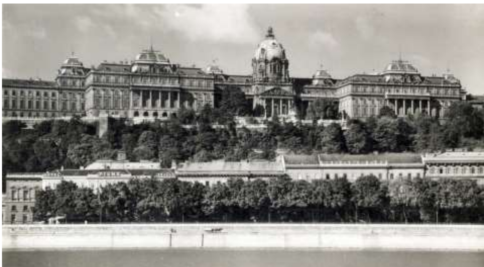
Budavári Palota, 1933

A konferencia címében feltett „ Élő műemlék – Rekonstrukció, de hogyan? ” kérdésre ezért a kérdőjel kiegyenesítése a válaszom: Élő műemlék – Rekonstrukció és Rehabilitáció, de hogyan!